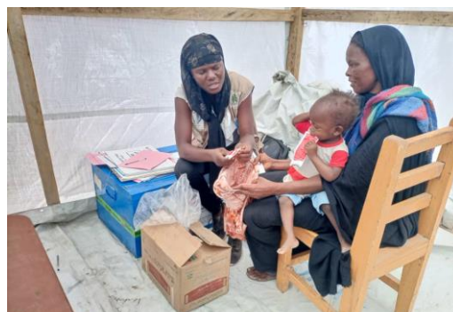
Séance de traitement de la malnutrition aiguë sévère avec plumpy nut sur un enfant de moins de 5 ans à Koufroun