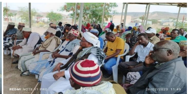
Visites à Ali Addeh et Holl Holl du Représentant et du Coordinateur Principal des Opérations EHAGL du HCR lors de sa mission à Djibouti en février 2023