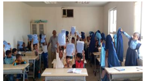
Distribution d'uniformes scolaires à l'école Markazi