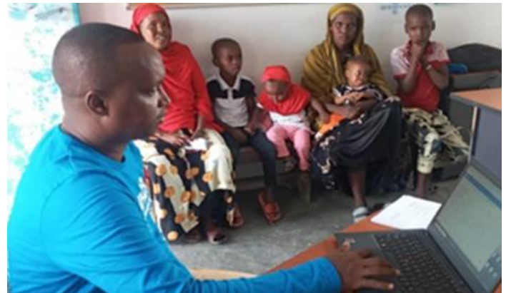
Exercice de vérification physique à Ali-Addeh