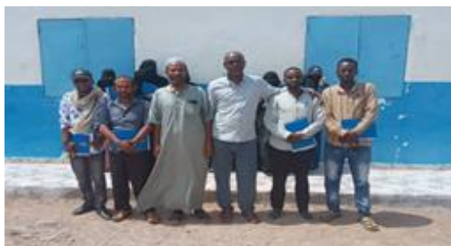
Formation des Enseignants à Markazi

Au cours du mois d'avril 2023, dans le cadre de renforcement de qualité des apprentissages, le partenaire du HCR pour l'éducation des personnes sous son mandat, le ministère de l'Education Nationale et des Formations Professionnelles (MENFOP), a tenu une formation centrée sur la pédagogie en faveur de 12 enseignants de l'école maternelle et de l'école primaire du camp de réfugiés de Markazi.