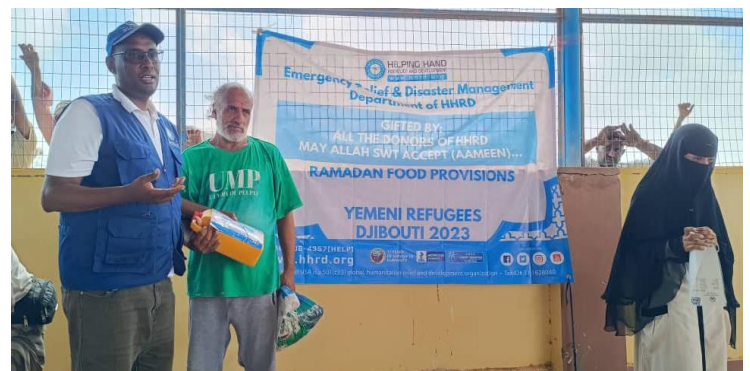
Distribution de vivres à Markazi par l'ONG HHRD

L'ONG internationale de bienfaisance « Helping Hands for Relief and Development » a distribué 800 paniers alimentaires sur le site Markazi pour les deux communautés, réfugiés yéménites et demandeurs d'asile Érythréens, dans le cadre de distribution des vivres à l'occasion du mois béni de Ramadan.