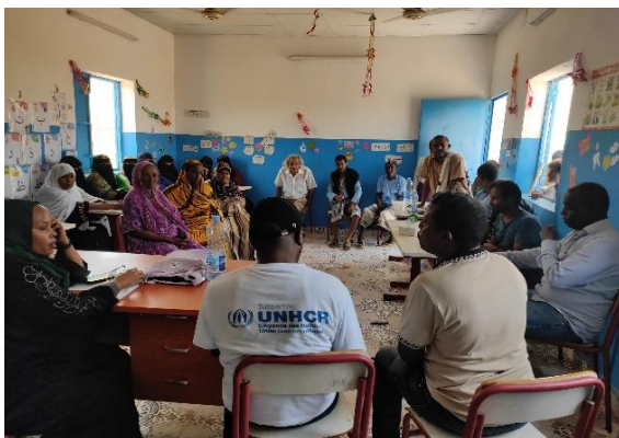
Exercice de revue des performances à mi-parcours 2023

Les évaluations et les entretiens avec les partenaires se sont basés sur les activités accordées entre le HCR et chaque partenaire (PPA), leurs rapports de performance à mi-parcours, la perception des réfugiés sur la plus-value de la mise en œuvre de ces mêmes activités par les partenaires, et des observations directes constatées par la MFT. Toutes les données récoltées et observées sont en cours d'analyse et de consolidation pour le Desk Review.