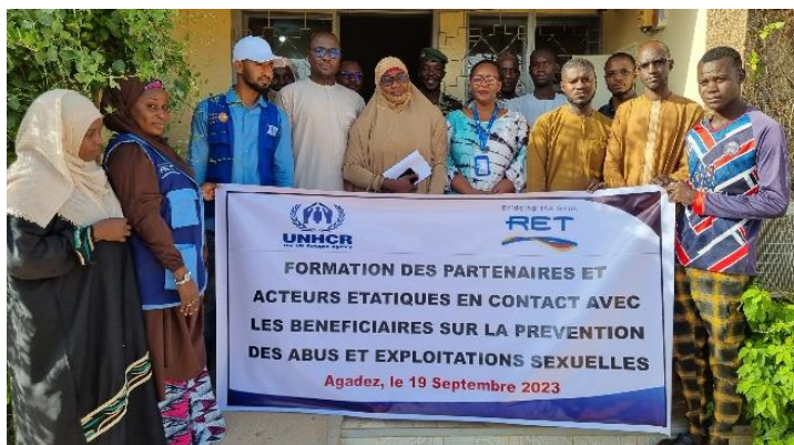
Les participant de la formation sur les PEAS posant à la fin de la formation