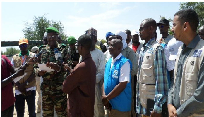
Le Général de brigade Ibrahim Bagadoma, nouveau gouverneur de la région de Diffa réitérant l'engagement des nouvelles autorités pour la protection et l'assistance aux réfugiés au camp de Sayam Forage