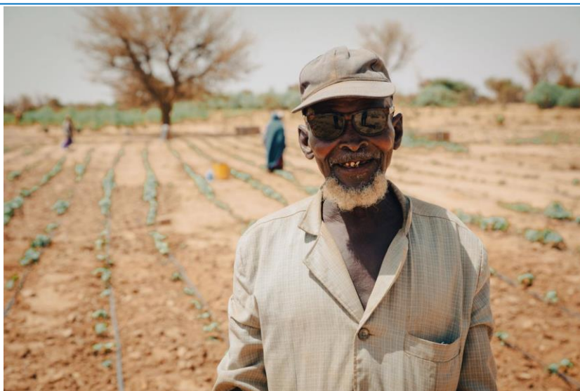
Le HCR s'engage auprès des populations déplacées de force (réfugiés & IDP) ayant besoin de protection et d'assistance à travers le Niger.