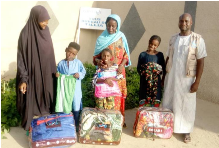
Distribution des kits de biens non alimentaires à six enfants vulnérables à Tillia

d'incidents liés à la violence basée sur le genre (VBG) et les services disponibles pour leur prise en charge.