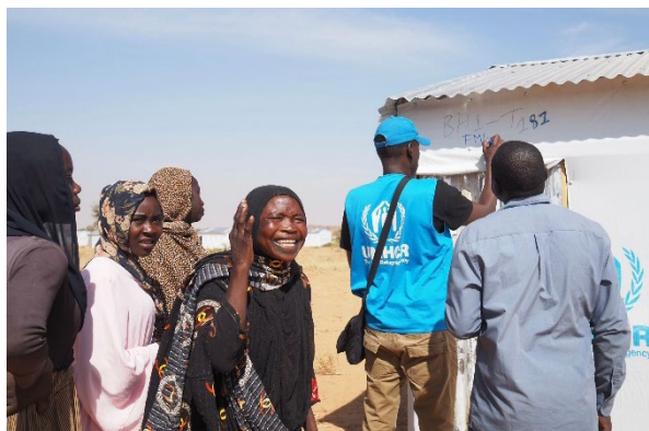
Une famille de réfugiés soudanais heureuse de trouver un abri à Farchana, à l'Est du Tchad. L'abri est essentiel pour rétablir la sécurité et la dignité des personnes forcées de fuir.

En plus de la province de Ouaddaï, actuellement l'épicentre des nouvelles arrivées, celle du Wadi Fira risque de connaître un nouvel afflux en raison de l'escalade du conflit vers le nord du Darfour, au Soudan.