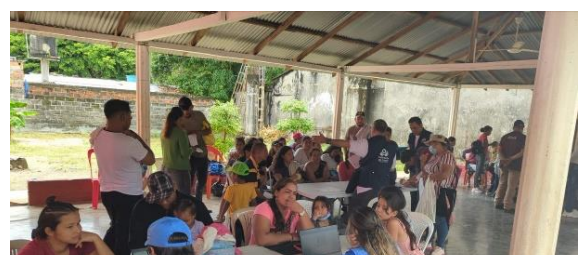
Feria de servicios para inscribirse en el Estatuto Temporal de Protección. Sur de Bolívar. 2022.