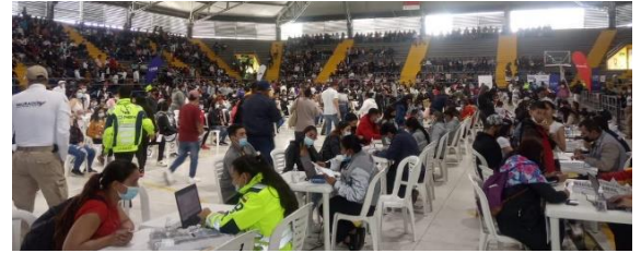
Promoción del acceso al PPT en el Palacio de los Deportes. Bogotá. 2022.

ACNUR consolidó su estrategia de acceso a la justicia con base en la coordinación de sus socios de asistencia legal, identificando oportunidades para el litigio estratégico frente a las principales barreras de acceso a derechos. ACNUR brindó asesoramiento legal sobre los procedimientos de Determinación del Estatuto de Refugiado (DER) a 7.520 solicitantes de asilo y refugiados.