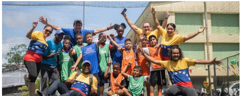
Un torneo deportivo para promover la integración social y conmemorar el Día Mundial del Refugiado en Quibdó, Chocó. 2022.

ACNUR proporcionó asistencia vital a desplazados internos, refugiados y migrantes, a través de socios, que en 2022 ofrecieron más de 1.2 millones de asistencias a beneficiarios directos. Además, ACNUR continuó con su labor de promover la protección en colaboración con el Gobierno de Colombia para avanzar en el acceso a los derechos de todas las poblaciones desplazadas.