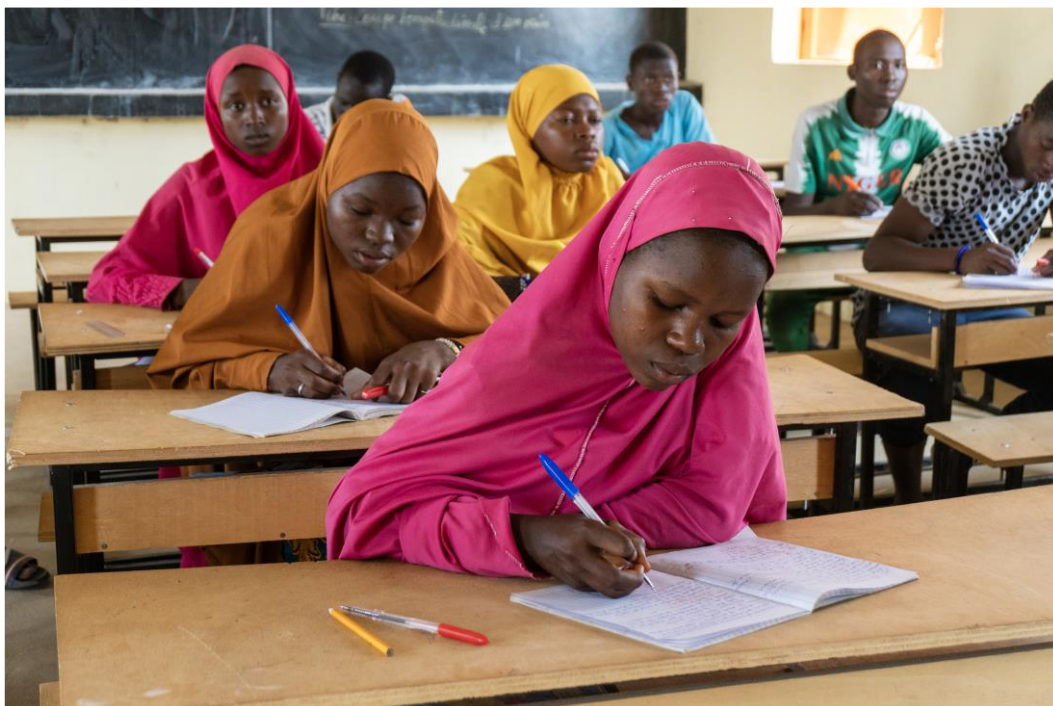
Des étudiants prennent note lors d'un cours de chimie à l'école de Doukou Doukou, dans la région de Tahoua, à une vingtaine de kilomètres de la frontière nigérienne.