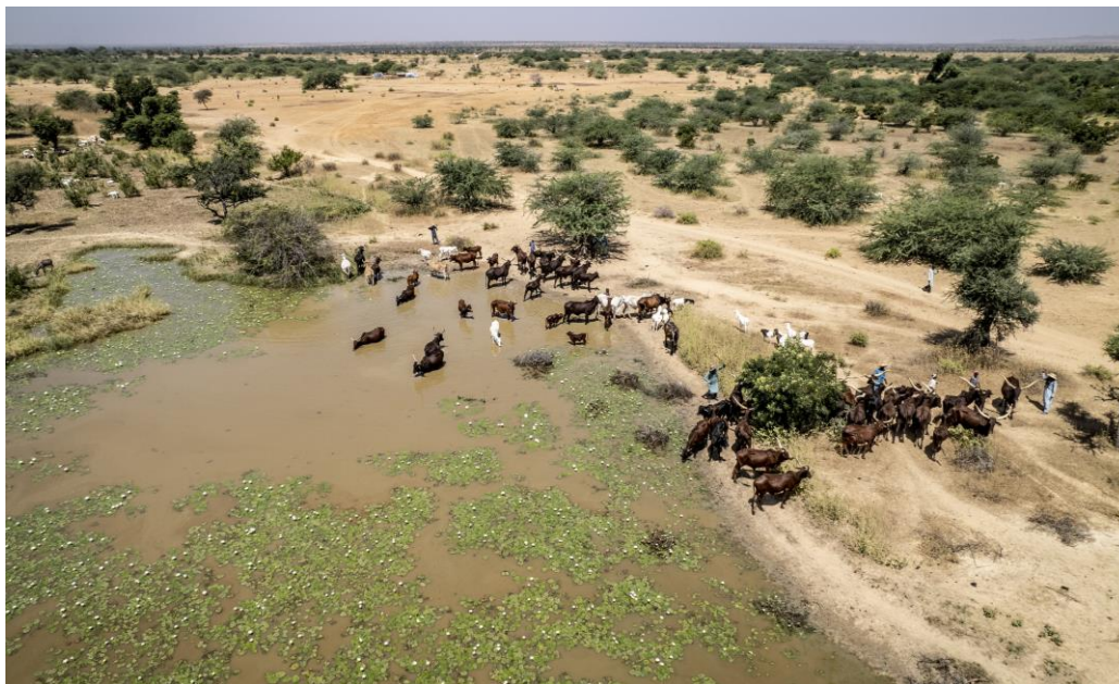
Des troupeaux s'abreuvent à une source d'eau à Malaye Rougga près de Bangui, dans la région de Tahoua. © HCR / Sylvain Cherkaoui/Top of Form