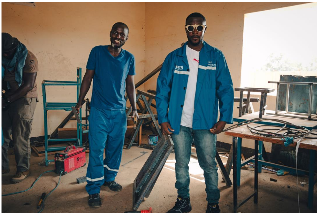
Deux réfugiés sourient à la caméra alors qu'ils travaillent dans l'atelier de menuiserie métallique construit et équipé par le HCR au site de Hamdallaye