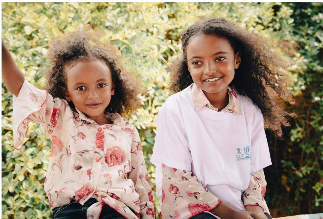
Deux enfants éthiopiennes évacuées de Libye, au centre de transit à Hamdallaye.