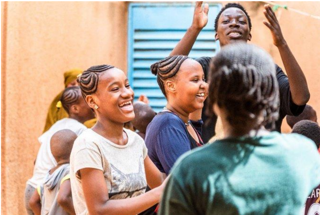
Des enfants évacués de Libye lors d'une séance d'activité récréatives au centre de transit de Hamdallaye, à Niamey.