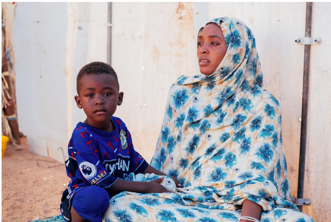
Une réfugiée originaire du Soudan et son fils au Centre humanitaire à Agadez.