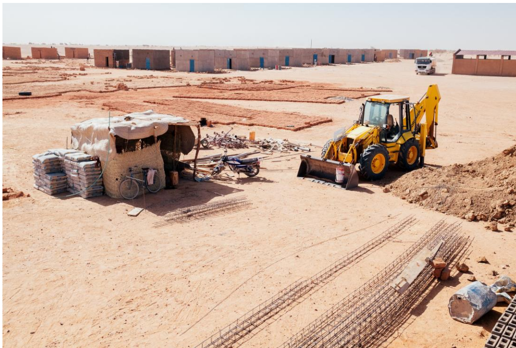
Construction de nouvelles maisonnettes au Centre humanitaire de Agadez.