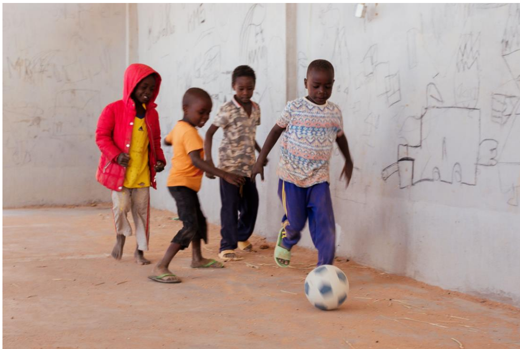
Des enfants jouent au ballon dans le Centre humanitaire à Agadez.