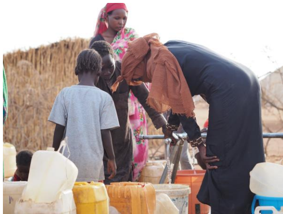
Réfugiés Soudanais à la collecte d'eau au site aménagé de Farchana, à l'est du Tchad.

Un remerciement spécial à nos principaux bailleurs en 2024 : Australie | Australie pour UNHCR | Belgique | Canada | Danemark | Espagne | | España con ACNUR | Etats-Unis | Japon pour UNHCR | Norvège | UNO-Flüchtlingshilfe | Pays-Bas | Programme Commun des Nations Unies sur le VIH/Sida | République de Corée | Royaume Uni | Suède | Suisse | Union Européenne | Autres donateurs privés.