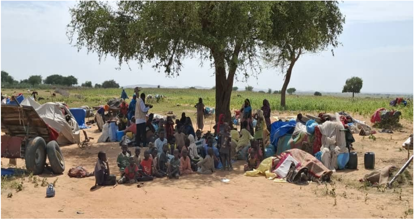
Nouveaux arrivants soudanais à Birak , province de Wadi Fira [TCHAD].

Birak, province de Wadi Fira, Chad – Depuis trois jours, environ 20, 500 réfugiés soudanais, en majorité des femmes et des enfants, sont entrés au Tchad, fuyant les combats intenses qui se déroulent dans leurs régions d'origine. Le conflit, qui a débuté le 30 septembre, continue de s'intensifier, forçant les gens à chercher la sécurité dans les villages frontaliers. L'afflux de réfugiés s'est concentré dans 10 sites dans la zone de Birak, notamment Korabo, Kamkam, Aringbote, Adola, DJatack, Grena, Hideba, Marfoua, Senette et Koulbous.