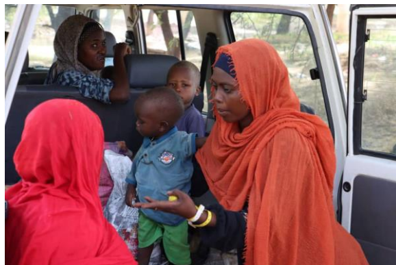
Relocalisation des Nouveaux arrivants de Tiné vers Kounougou dans la province de Wadi Fira, à l'est du Tchad.

des Nations unies pour les réfugiés, et ses partenaires relocalisent 439 nouveaux arrivants de Tinée, dans la province de Wadi Fira. Dans les prochains jours, 462 réfugiés supplémentaires devraient être transférés de Tine vers les sites aménagés. La relocalisation des réfugiés d'Adré vers Dougui reprendra dès que les routes seront à nouveau praticables pour les camions.