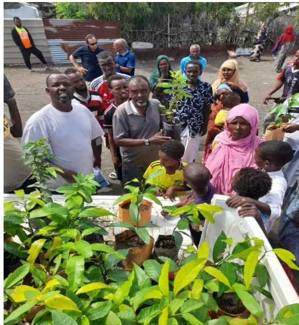
Les réfugiés ont reçu les arbres fruitiers pour les planter

De fortes pluies provoquent des inondations dans la région d'Obock. La saison des pluies en cours à Djibouti a entraîné de fortes pluies qui ont provoqué des inondations à Obock, notamment à Markazi, une région qui accueille plus de 2 400 réfugiés. Les inondations ont détruit les abris et causé d'autres dégâts ; environ 73 ménages de réfugiés ont été contraints de déménager. Le HCR, en collaboration avec les autorités locales et ses partenaires, continue de surveiller et d'enregistrer les dégâts afin de fournir une réponse bien coordonnée. Il a été conseillé aux réfugiés d'éviter de traverser les zones inondées et de rester à l'écart des poteaux électriques et des logements instables pour éviter tout risque d'accident et de blessure.