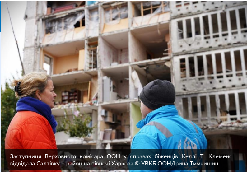
Заступниця Верховного комісара ООН у справах біженців Келлі Т. Клеменс відвідала Салтівку – район на півночі Харкова

12 листопада на брифінгу у Женеві Келлі Т. Клеменс звернула увагу на стійкість людей, з якими вона зустрічалася в Україні, і закликала до більшої підтримки, щоб допомогти цивільному населенню пережити осінньо-зимовий період, оскільки російські обстріли і далі руйнують енергетичні та інші об'єкти цивільної інфраструктури. Читайте більше ТУТ .