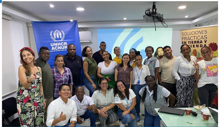
Foro de legalización urbanística en conjunto con el Ministerio de Vivienda y Opción Legal en Chocó. 2023.

19 asentamientos informales cuentan con una estrategia de intervención para apoyar los procesos de legalización urbanística.