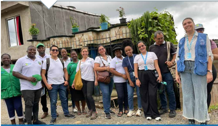
Reunión entre la comunidad, ACNUR y el Ministerio de Vivienda para promover la legalización y titulación de asentamientos de origen informal en Quibdó, Chocó. 2023.