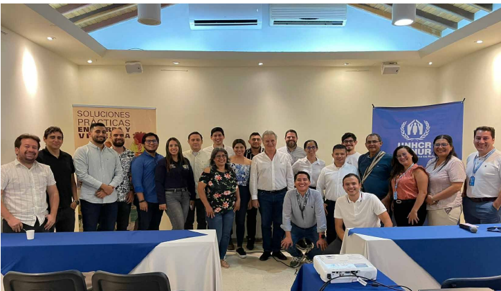
Foro de legalización urbanística para el barrio Brisas de los Andes en Cúcuta, Norte de Santander. 2023.

9 comunidades indígenas apoyadas en temas relacionados con el saneamiento, ampliación o constitución de resguardos.**