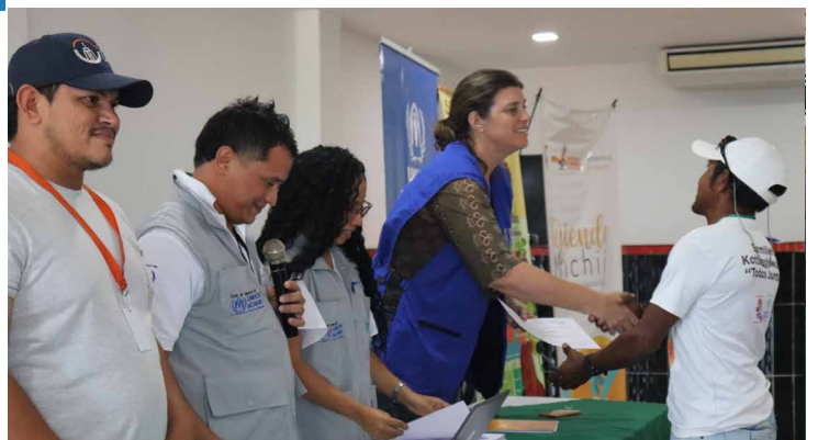
Entrega de certificados sobre los talleres de capacitación para la comunidad residente del asentamiento del aeropuerto de Uribia en La Guajira. 2023.

5 talleres regionales fueron realizados por el Ministerio de Vivienda Opción Legal para capacitar a los actores en la regularización y titulación de asentamientos informales.