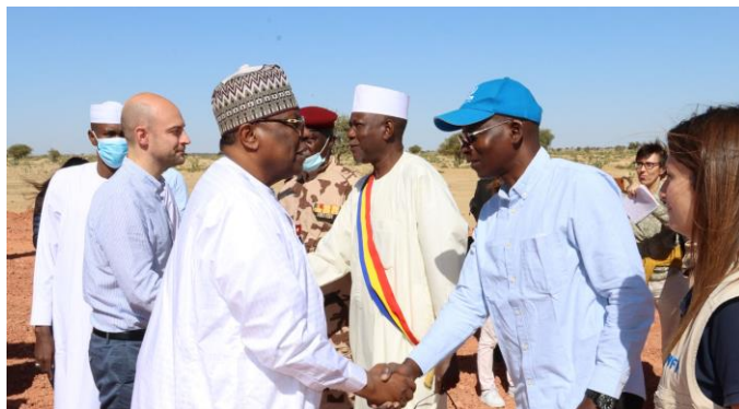
Mission du Ministre français des Affaires Etrangères, son homologue du Tchad, le Sous-Secrétaire Général des Nations Unies pour les Affaires humanitaire, le Coordonnateur Résident du Système des Nations Unies au Tchad et le Représentant du HCR à Adré.