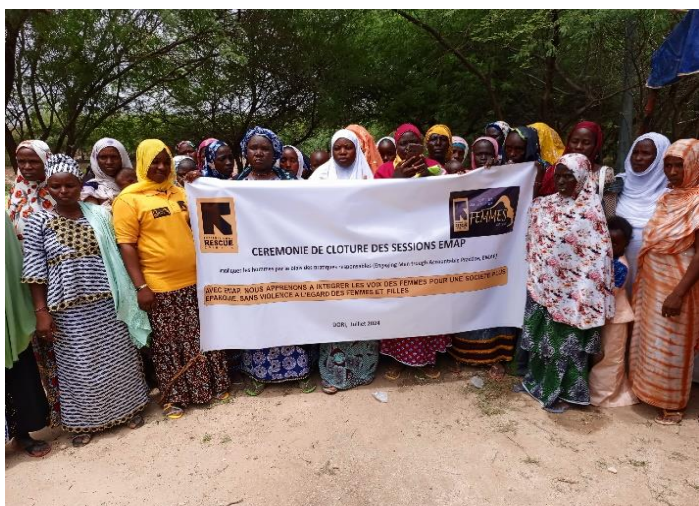
« Participantes à la cérémonie de clôture des sessions de l'approche « EMAP » »

Les 05 et 06 septembre 2024, IRC a commémoré ses 05 ans d'existence au BURKINA FASO. La région du Sahel l'a commémoré en différé les 18 et 19 septembre 2024. Les activités entrant dans le cadre de cette célébration étaient : une conférence, une journée porte ouverte, une séance aérobique, un match de football et un repas communautaire suivi d'une coupure de gâteau en présence de plusieurs invités. Pour ce qui concerne la journée porte ouverte, des produits fabriqués dans les espaces sûrs ont été exposés par les femmes. Ces produits étaient composés de tissus brodés, produits tricotés, paniers, objets de décoration, chapeaux de paille, éventails en paille de savon liquide etc. Ce fut l'occasion pour les femmes de vendre leurs produits et de générer des ressources.