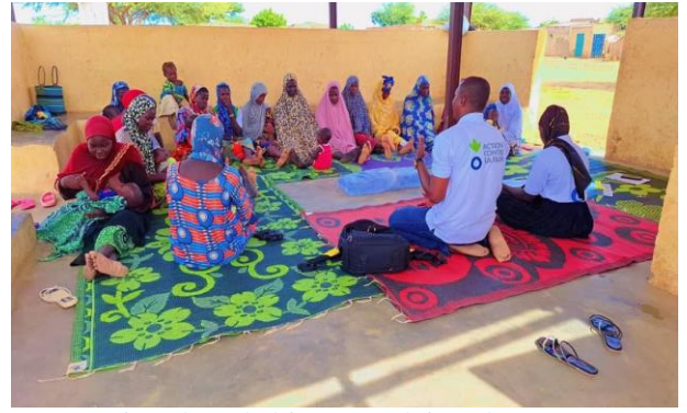
« Séance de psychothérapie groupale à Wendou »