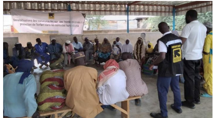
« Causerie éducative avec les leaders communautaires dans le quartier Niarala le 24/09/2024 »