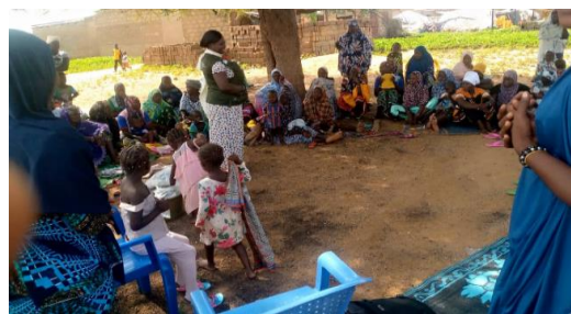
« Sensibilisations communautaires sur les risques de protection »