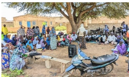
« Campagne de sensibilisation de masse sur les VBG au profit des PDI à Dori »