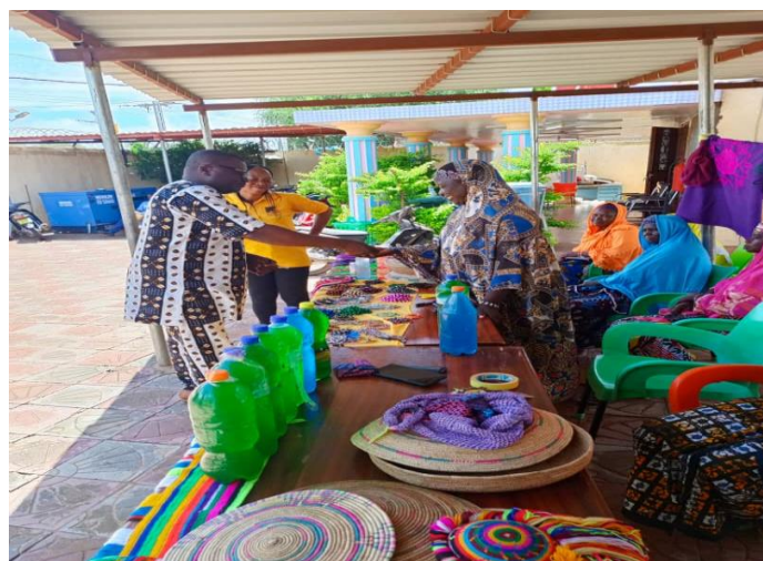
« Exposition à l'occasion de la commémoration des 5 d'existence »