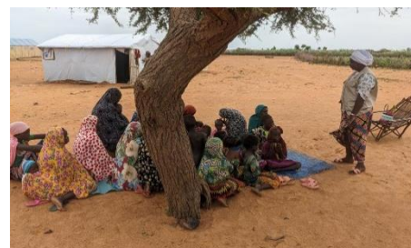
« Causerie éducative sur les VBG au profit des PDI à Gorom-Gorom » ©CREDO