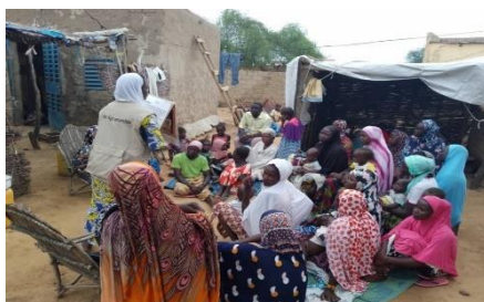
« Causerie éducative sur les VBG au profit des PDI à Sebba »