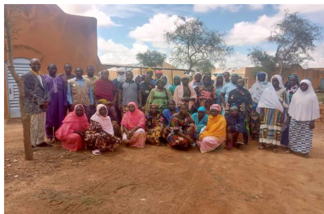
« Focus groupes sensibilisation sur la cohésion sociale Djibo / comités »