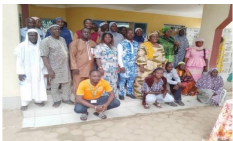
« Dialogue communautaire à Dori »