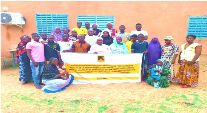
« Photo de famille des participants à l'atelier sur la prise en charge des EROST »

Le 31 juillet 2024 se sont tenues les activités de clôture des sessions du programme de Soutien aux Familles et aux Adolescents en Situation d'Urgence (SAFE). En rappel les activités de SAFE se sont déroulées autour de 16 séances d'animation au profit de 50 adolescentes et 50 adolescents des tranches d'âges 10-14 et 15-19 ans, et 08 séances d'animation au profit de 25 tuteurs et 25 tutrices. Le programme SAFE est une intervention de protection et de soutien psychosocial qui vise à développer les connaissances et les compétences émotionnelles et sociales des adolescentes et des adolescents pour être en mesure d'accroître leur propre sécurité et faire face au stress. Les services disponibles pour leur protection sont également présentés au cours du programme. SAFE implique également les tutrices et les tuteurs en tant qu'adultes clés dans la vie des adolescents, et développe leur compréhension de la façon de protéger et de soutenir leurs adolescents. C'était une occasion de faire une révision générale sur les points clés dispensés au cours des séances d'animation. La célébration a eu lieu au sein des Espaces Amis des Enfants où se déroulaient les animations dans le quartier de Wendou. Cette célébration vient donc couronner 3 mois d'apprentissage et de socialisation pour mieux répondre aux besoins des adolescentes et adolescents ainsi que de leurs parents.