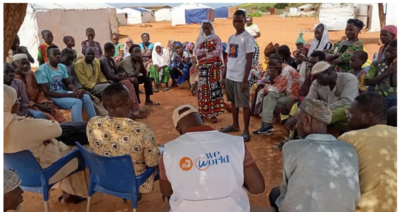
« Assemblée générale de désignation des membres de comités de plainte et les points focaux au site PDI Hors stade »