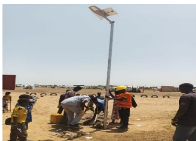
« Installation de lampadaire à Dori »