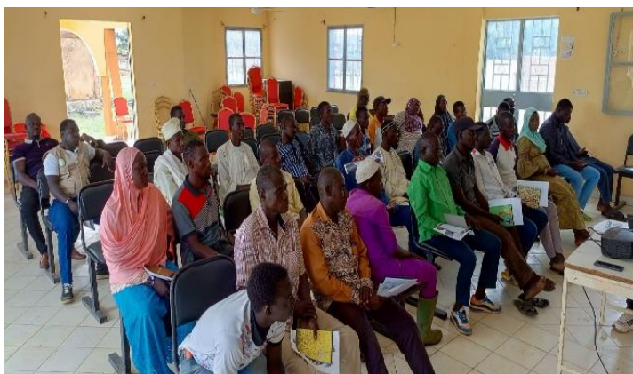
« Sensibilisation des comités locaux de protection sur les concepts clés de protection à Sebba »

Sukaabe Ginan : L'association Sukaabe Ginan intervenant dans la province du Séno a réalisé 01 théâtre forum sur l'importance de la documentation civile dans la commune de Dori sur le site de Gnarala bloc02 au profit des PDI et populations hôtes. Les objectifs de cette activité étaient entre autres de sensibiliser les populations sur les conséquences de la non-documentation, sur les procédures à suivre pour l'obtention d'un document civil, de promouvoir l'accès aux droits fondamentaux et renforcer l'identité légale des populations. Aussi il a été réalisé 01 théâtre fora sur la prévention et la gestion pacifique des conflits au sein des communautés déplacées et les populations hôtes de la ville de Dori. Ces 02 activités ont touché environ 865 personnes dont 210 hommes, 320 femmes, 147 garçons et 188 filles.