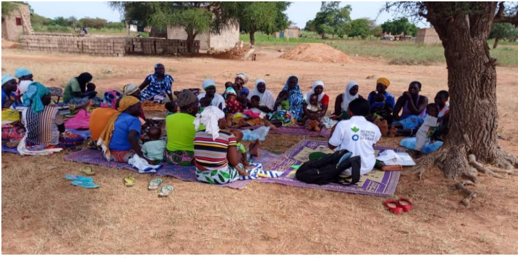
« Séance de sensibilisation sur la santé mentale »