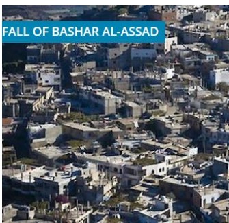
República Árabe de Siria La plataforma ECOI ofrece un recopilatorio de material sobre la situación en el país tras la caída del régimen de Bashar al-Assad en diciembre de 2024