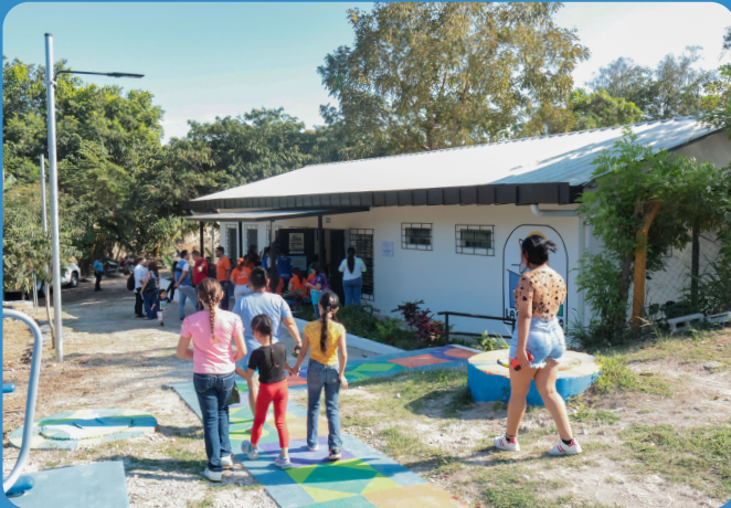
Vecinos reunidos en La Campanera, Soyapango, para la inauguración de su renovada casa comunal.