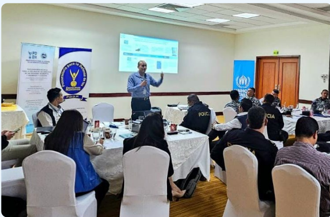
Personal de la PDDH durante un taller sobre protección internacional para personal de la Policía en La Unión.