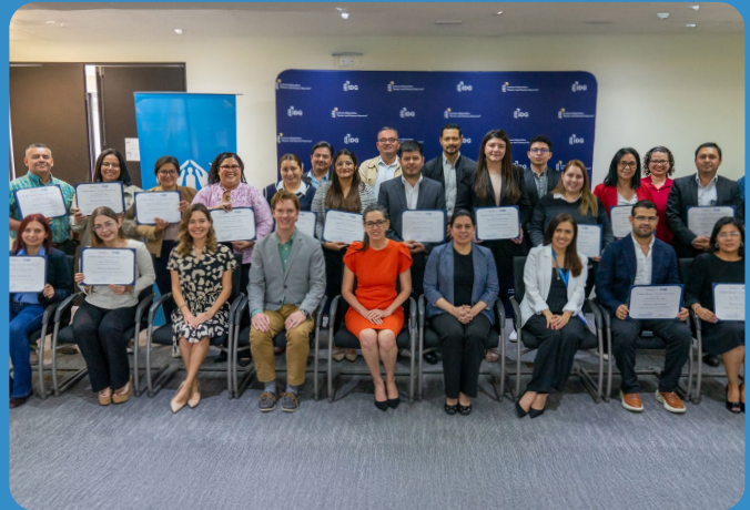
Representantes de instituciones y organizaciones durante la clausura de un diplomado sobre protección internacional apoyado por ACNUR.