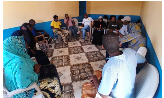
Le HCR et ses partenaires sensibilisent les réfugiés et demandeurs d'asile suite à la déclaration du ministre de l'intérieur djiboutien de la nouvelle stratégie politique

appelant à tous les ressortissants étrangers résidant illégalement à Djibouti à quitter le pays volontairement et pacifiquement dans un mois. Ces sensibilisations ont pour objectives de limiter les potentiels risques de déportation lorsque les contrôles commenceront et les encourager de porter leurs documents d'identité sur eux à tous moments. Les réfugiés et demandeurs d'asile ayant besoin de renouveler leurs documents ont été aussi appelés à effectuer le renouvellement nécessaire pour tous documents expirés ou expirant bientôt.