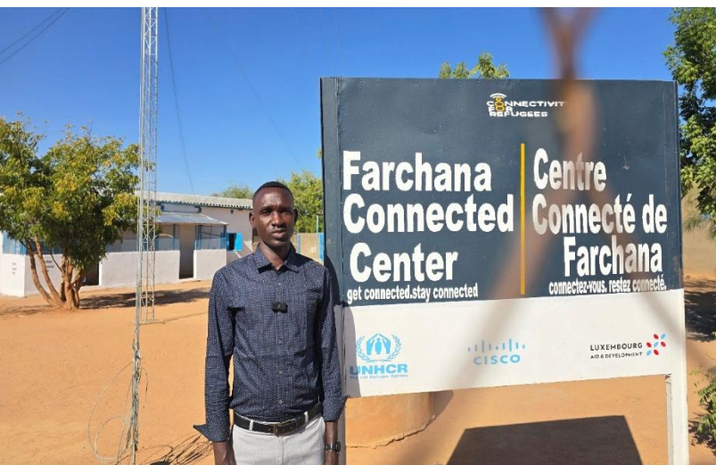
Farchana, le 27 janvier 2026