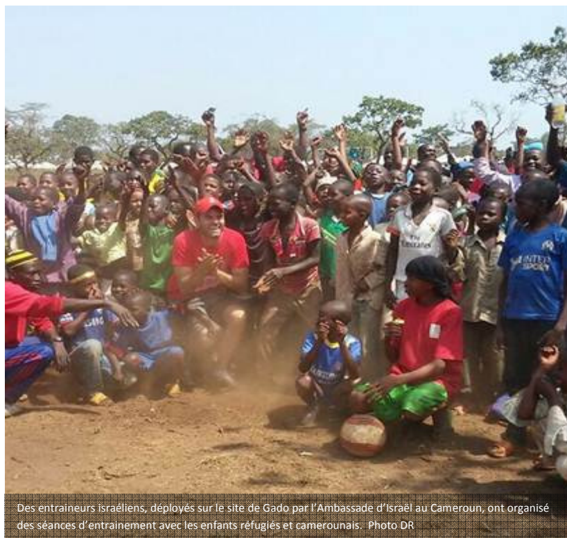
Des entraîneurs israéliens, déployés sur le site de Gado par l'Ambassade d'Israël au Cameroun, ont organisé des séances d'entraînement avec les enfants réfugiés et camerounais.