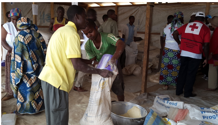
Distribution des vivres du PAM sur le site de réfugiés de Gado.