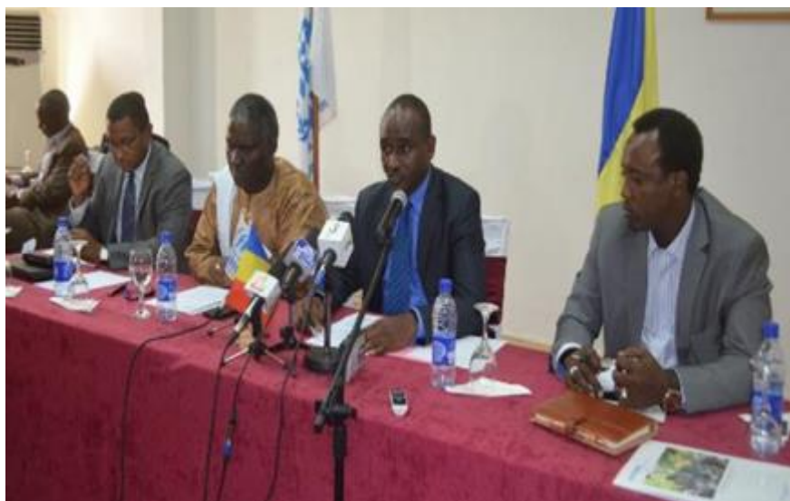
Lancement de l'opération de vérification le 10 mars 2015 avec le Secrétaire Général de l'Administration du Territoire et de la Sécurité Publique, au nom de Son Excellence le Ministre de l'Administration du Territoire et de la Sécurité Publique, et le Représentant de l'UNHCR au Tchad.