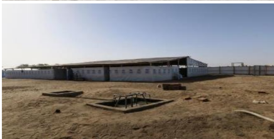
Centre de vérification en fin de journée après le dur labeur.