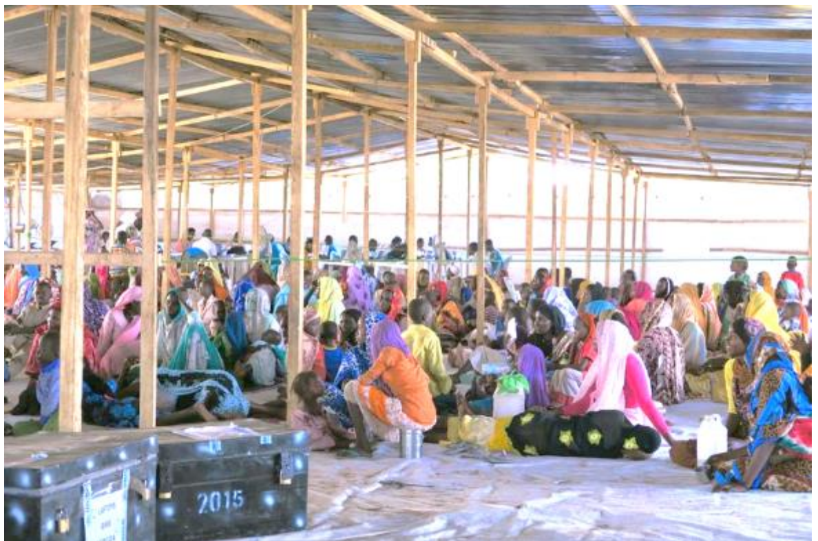
Familles installées dans la zone tampon en attente de la capture de leurs données biométriques