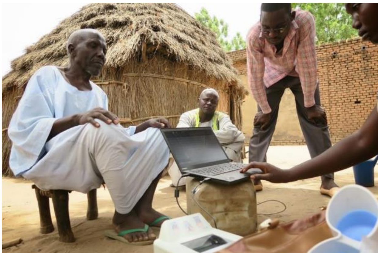
Personnes à besoins spécifiques en incapacité de se rendre sur le centre de vérification prises en compte dans le processus grâce aux visites à domicile avec capture de données biométriques.