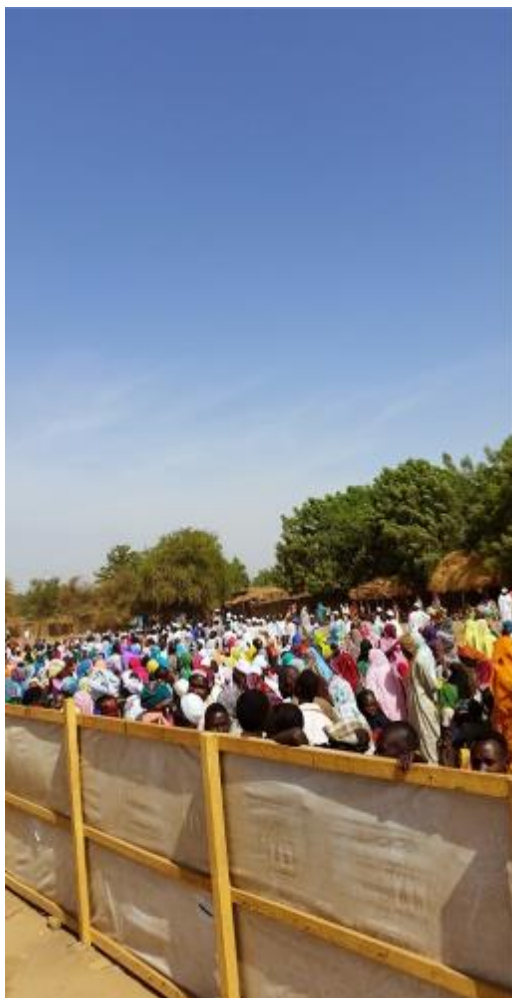
Début du processus (Camp de Goz-Amer) : Réfugiés convoqués pour la journée en attente hors du centre de vérification et agents de la CNARR en pleine capture des données biométriques (empreintes digitales et iris).