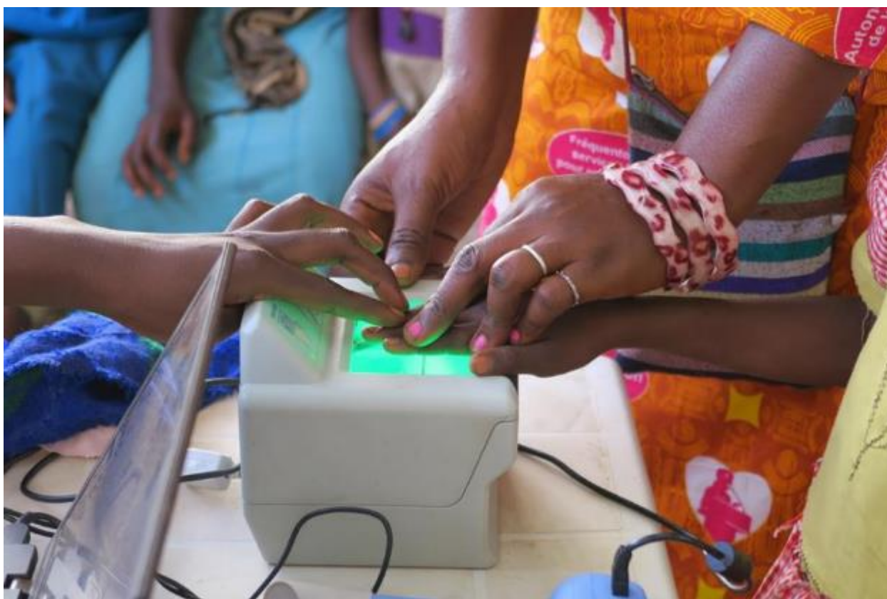
Difficultés de capture des données biométriques de certaines personnes âgées (un seul iris dans le cas ci-dessus) et des enfants en bas âge (empreintes digitales de la fillette).