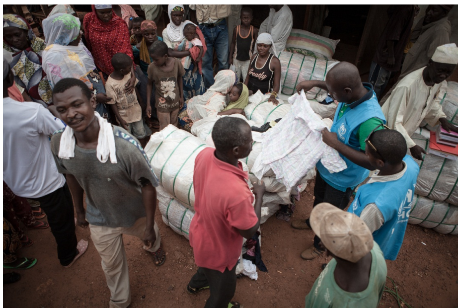
Distribution de vêtements aux communautés réfugiée et locale à Gari Gombo.