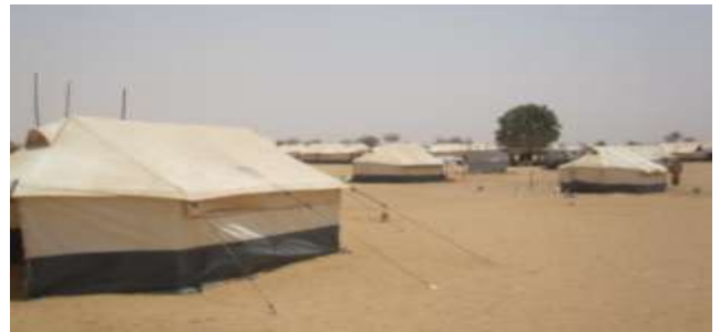
Tentes du camp d'Abala - mai 2012