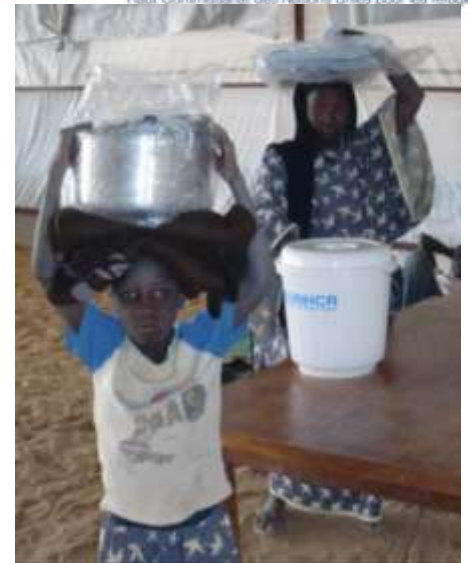
Enfants réfugiés - Camp d'Abala - Avril 2012