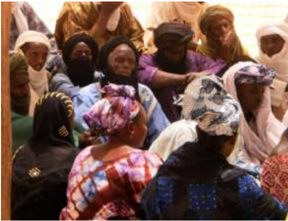
Réunion des membres du Comité de gestion du camp - mai 2012