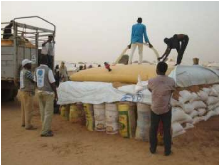
Remplissage d'un bladder au camp d'Abala, Avril 2012

○ Construction possible d'un 2 ème forage : si le premier forage ne fournissait pas l'eau en quantité et/ou qualité suffisante, il conviendrait d'entamer rapidement un deuxième forage. De même, augmenter la quantité d'eau disponible sur le camp permettrait d'augmenter la capacité d'accueil du camp d'Abala. Notons à cet effet, qu'un forage, dont le débit est de 5,4 m 3 /h, a récemment été construit sur la ville d'Abala dans le cadre du « programme de la Coopération chinoise ». L'eau est de bonne qualité et UNICEF s'est engagé à équiper ce forage et à réaliser une Mini Adduction d'eau potable. Ce système d'approvisionnement pourrait également fournir une source d'eau supplémentaire à l'avenir pour le camp.