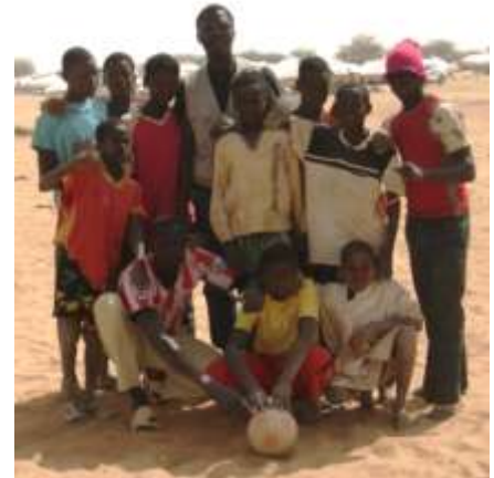
Equipe de foot - Camp d'Abala, Avril 2012