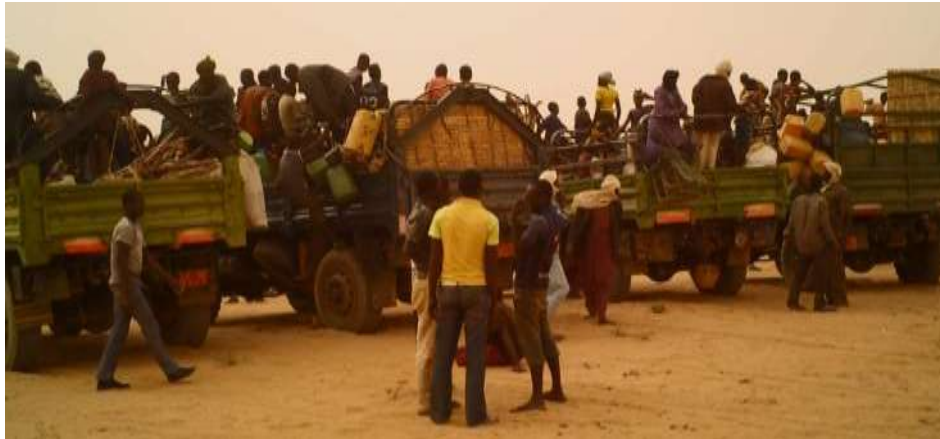
Arrivée massive des réfugiés sur le camp d'Abala - avril 2012