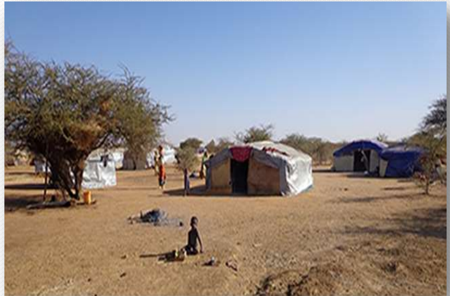
ABRIS NRC/ GOUDEBO/ 2013/ BD