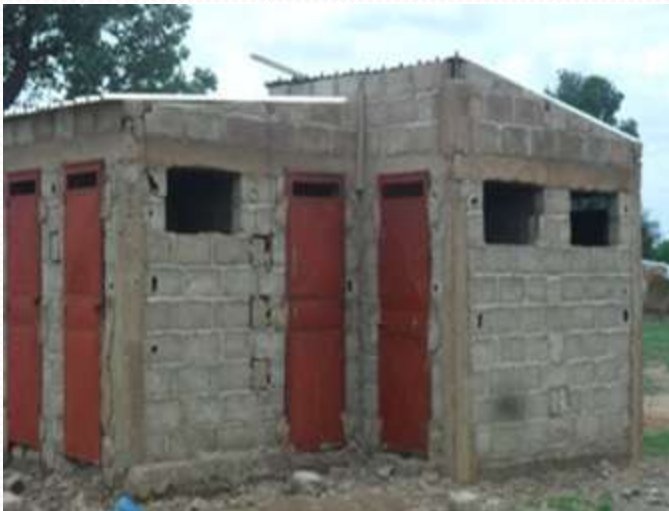
Travaux de construction de latrines VIP a Sag Nioniogo.