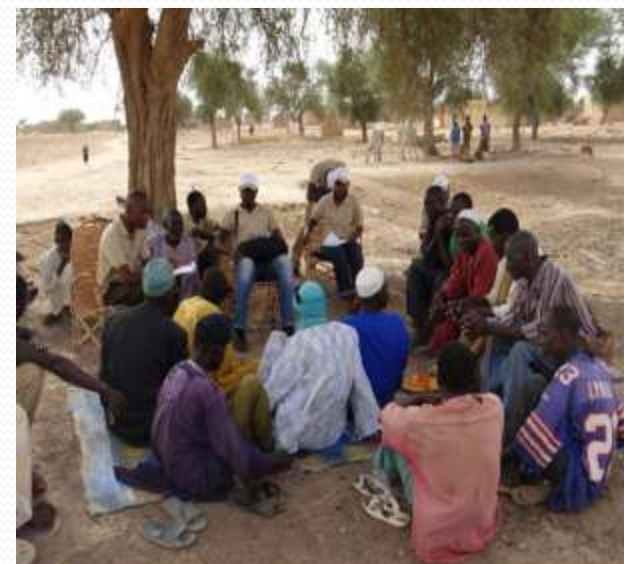
ADRA : Séances de sensibilisation à Ingani (Village hôte de Mentao)