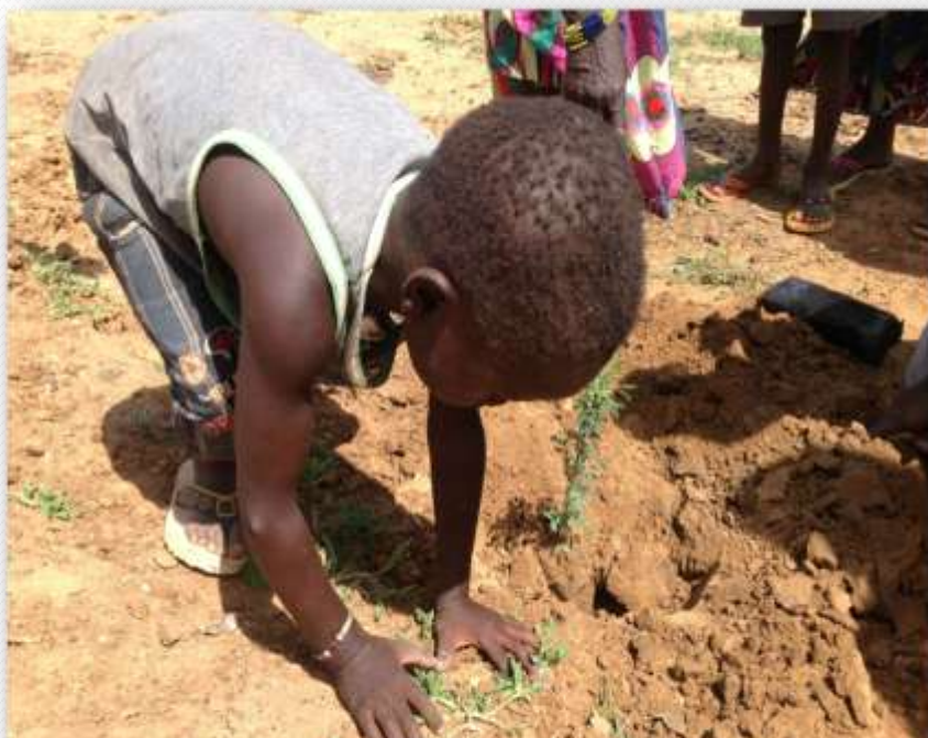
Journée de reverdissement de Goudoubo : Un enfant de la communauté hôte apprenant à planter un arbre.