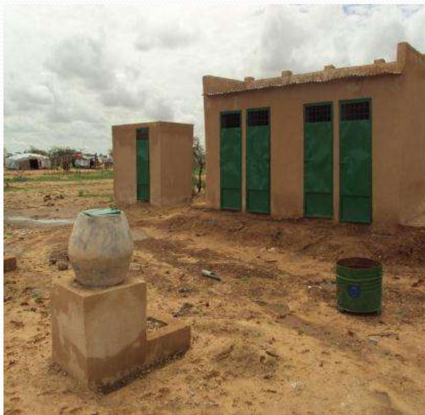
Blocs de latrines VIP et douches réalisées par HELP