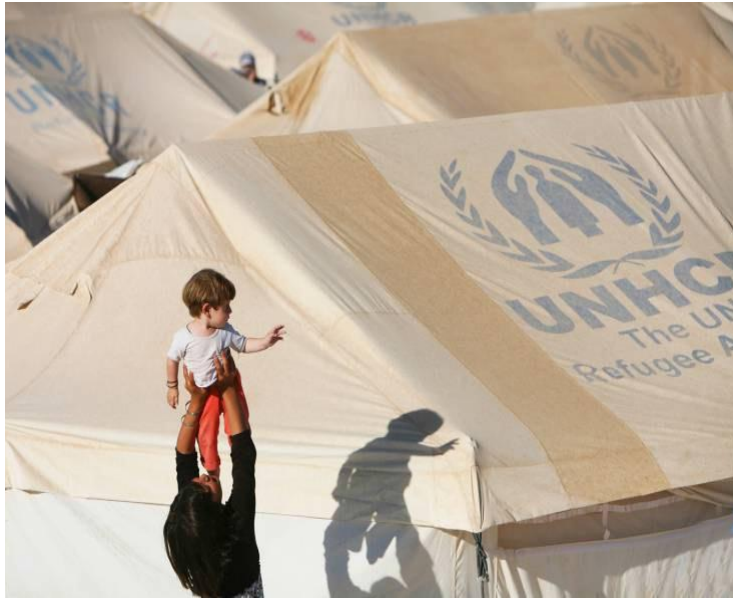
فتاة سورية تلعب في فترة بعد الظهر مع طفل في مخيم Akcakale للاجئين في جنوب تركيا.