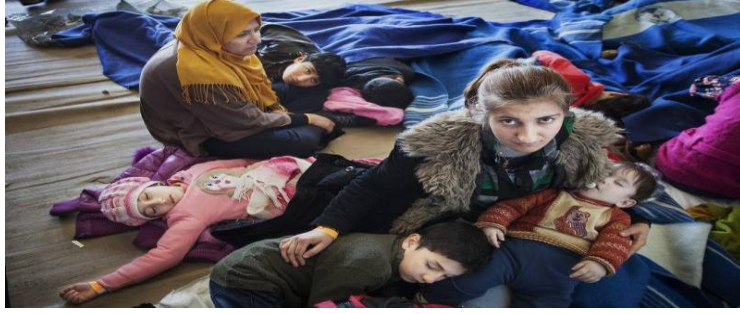
أم سورية على السفينة الإيطالية، فيرغا، مع أطفالها الصغار. جرى إنقاذهم من مركب صيد ينقل 219 شخصاً أثناء محاولتهم عبور البحر المتوسط من ليبيا.

الاستجابة الإقليمية للاجئين الفارين من سوريا هي جهود منسقة بين 157 منظمة مشاركة، منها 105 توجه نداء، وهي: