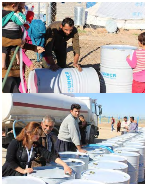
توزيع منظمة (YAO) لمادة النفط في مخيم عربت