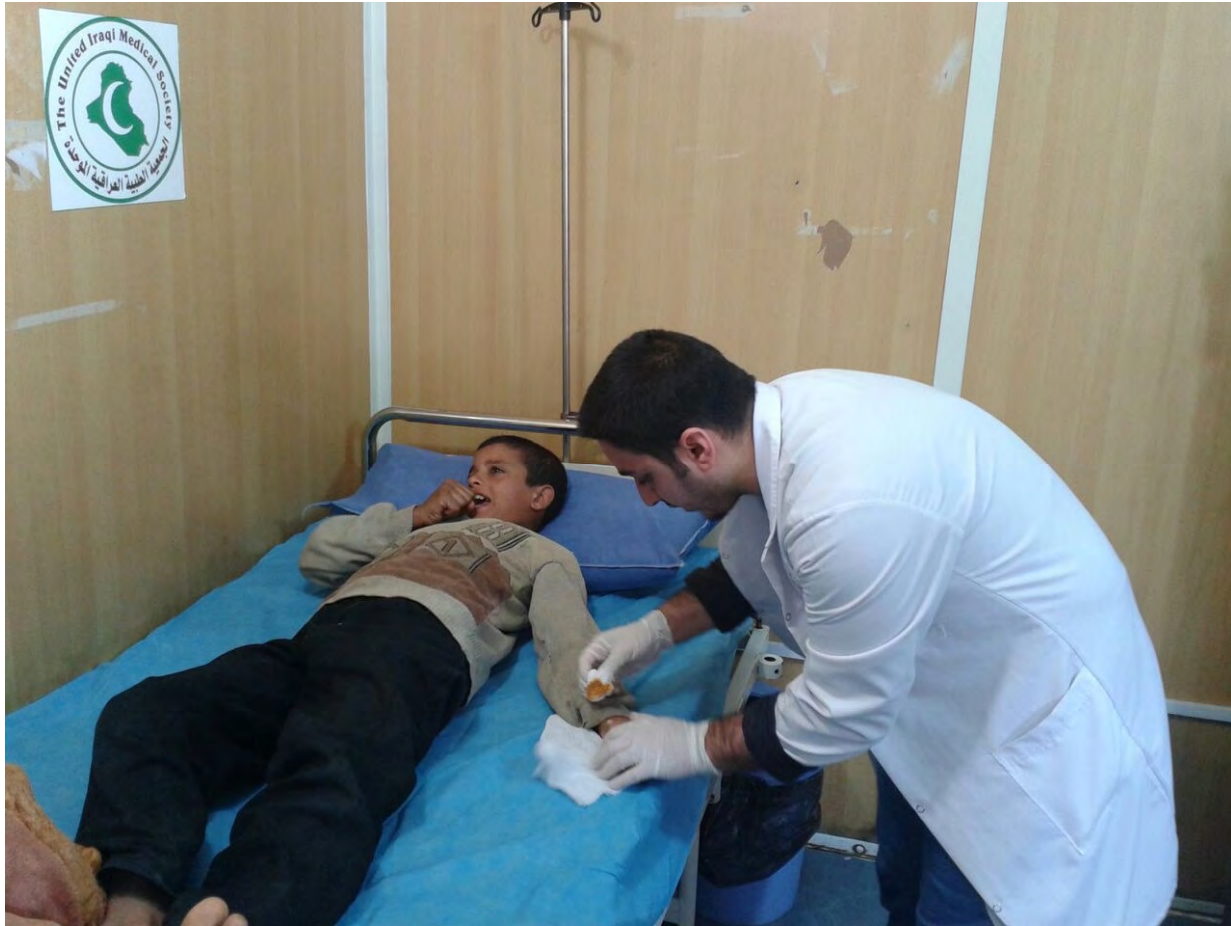
طفل سوري يتلقى الاهتمام الطبي من الجمعية الطبية العراقية الموحدة في مخيم العبيدي- الجمعية الطبية العراقية الموحدة