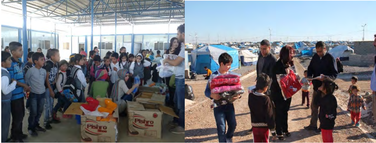
توزيع مواد الإغاثة الأساسية في كاويلان