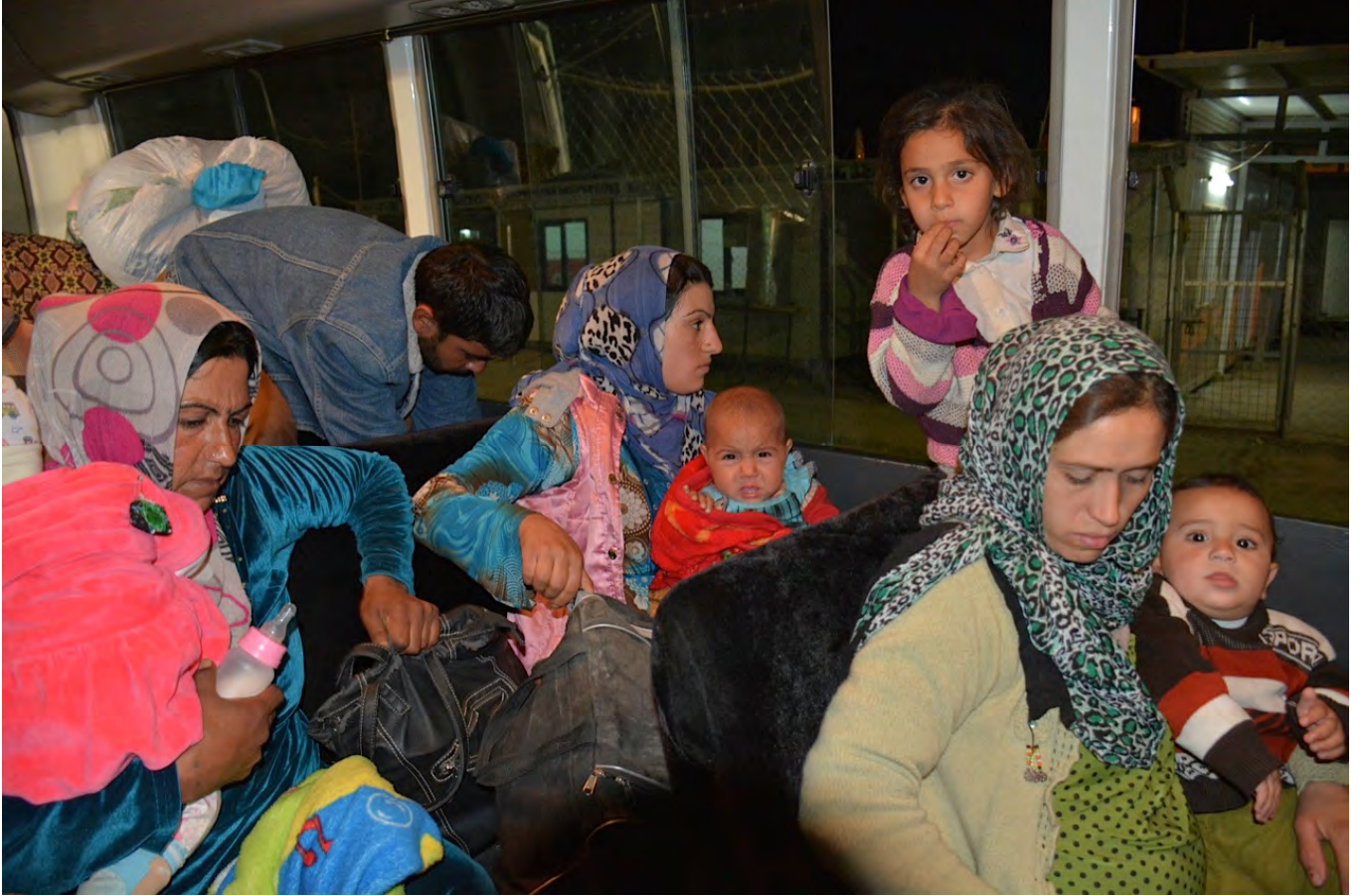
السوريون الفارون من القتال في كوياتي عند وصولهم الى مخيم قوشتابا للاجئين