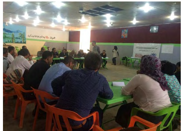
تدريب على إدارة الاعمال التجارية الصغيرة في مخيم دوميذ-المفوضية