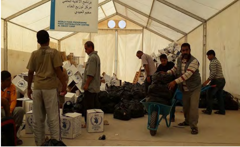
توزيع برنامج الغذاء العالمي للطرود الغذائية في مخيم العبيدي عبر الاغاثة الاسلامية