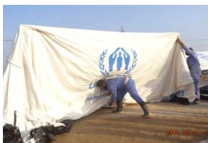
منظمة الانقاذ الانسانية العراقية تقوم باستبدال الخيم وتوزيع مواد الإغاثة الأساسية في مخيم العبيدي