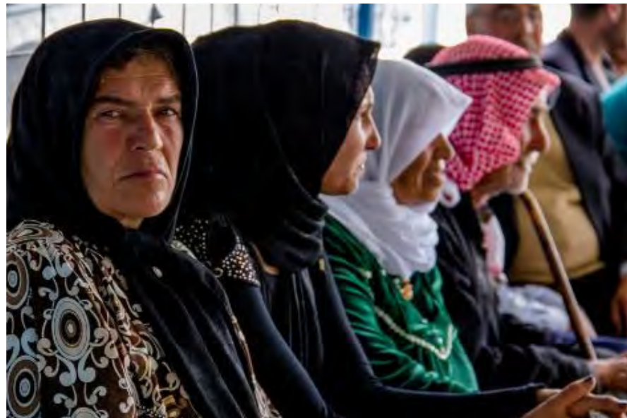
اللاجئون السوريون بانتظار التسجيل عند مركز تسجيل المفوضية في مخيم گاويلان في محافظة دهوك بعد أن نقلتهم المنظمة الدولية للهجرة من معبر فيشخابور