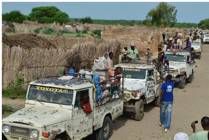
Relocation des Réfugiés Nigérien à Ngouboua, Aout 2014.