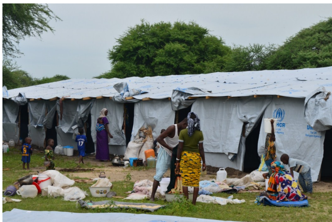
L'Arrivée des réfugiés Nigérien à Ngouboua; aout 14