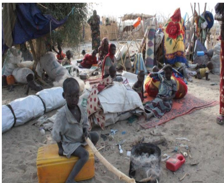
Réfugiés Nigériens de Hakoui Tchouloum