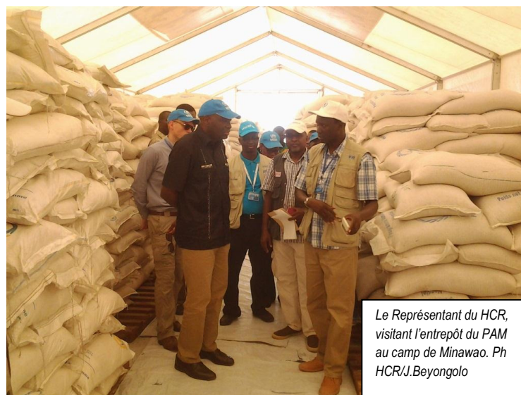
Le Représentant du HCR, visitant l'entrepôt du PAM au camp de Minawao.