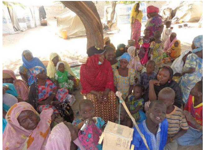
Sensibilisation sur le site des malvoyants. Photo, IRC, novembre 2015.