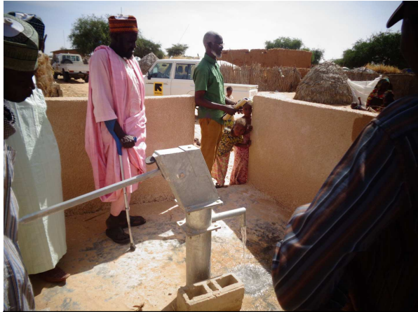
Réception de forage à Chétimari. Photo, IRC, novembre