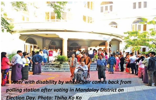
A voter with disability by wheelchair comes back from polling station after voting in Mandalay District on Election Day.

ကီအုရှာဉ်ပုဉ်ယံကရုလတံမလတံသးထာလတံသဘျူအကီလအခိဉ်ကန့ဉ်ထွဲမုဉ်ဒီးအနံဘီမိုစာဖိုင်အဝဲသွင်အံဉ်န့ဉ်ပကြာပွဲကော်ပယ်ဖိဖိဖိုင်အဝဲသွင်အိဉ်ဒီးတံသးစူ၊တံသးသွင်လကပီဒီးတံသွင်ဆူသးဂဲအာယီ