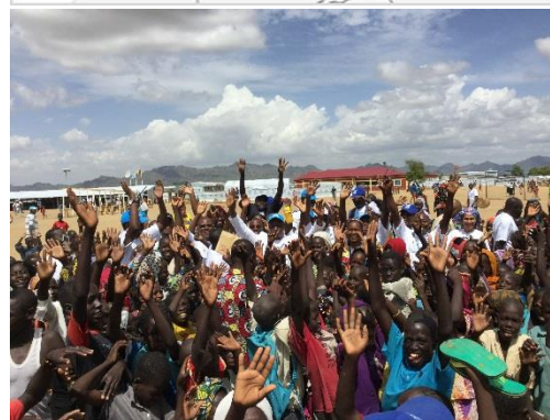
Célébration de la journée mondiale des réfugiés 20 Juin 2016