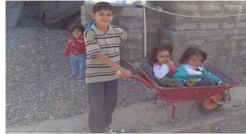
مخيم جويلاز للاجئين، دهوك

ويُعتبر توافر الإمكانية المتزايدة لحصول السوريين على وثائق الحالة المدنية، أيضاً، عُصراً أساسياً من عناصر الاستجابة الخاصّة بالحماية. وتسعى الشراكات مع المُجتمع المدني والحكومات المضيفة إلى تحسين إمكانية تسجيل واقعات الزواج، وهو تدبير يزيد من مستوى حماية النساء. وتقتضي الحاجة تكوين شراكات مع المستشفيات للتأكد من قدرة النساء اللاجئات الحوامل على الولادة بأمان، وعلى الحصول على الإشعار الطبي عن حالة الولادة، لأجل تسجيل المولود حديث الولادة. كذلك تقتضي الحاجة أيضاً توفير فرص إضافية لإعادة التوطين، ولأشكال أخرى من سُبل الدخول إلى البلدان الأخرى، ومنها منح التأشيرات لأسباب إنسانية، والبعثات الأكاديمية (الدراسية)، وبرامج تنقل العمال.