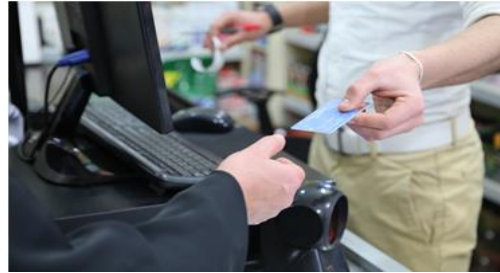
إمرأة سورية تقوم بشراء الغذاء من خلال بطاقة برنامج الغذاء العالمي في شمال لبنان

وستستمر مساهمة حديثة من ألمانيا للجهات المشاركة في الخطة الإقليمية للاجئين وتعزيز القدرة على مواجهة الأزمات بمواصلة تقديم المساعدات الغذائية لأكثر من 700,000 لاجئ سوري مُعرَّض للخطر، وأكثر من 50,000 لبناني مُعرَّض للخطر. وبالإضافة إلى ذلك، استخدمت الحكومة التي عازمت على تنفيذ البرنامج الوطني لاستهداف الأسر الأكثر فقرًا بطاقاتٍ إلكترونية مشابهة لتقديم مساعدات غذائية للعائلات اللبنانية. وسيُتولَّى برنامج الأغذية العالمي تمويل هذه المساعدة في الفترة من يوليو حتى نهاية العام.