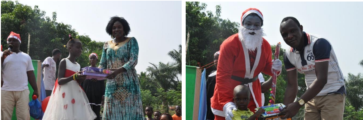
Un staff du HCR Togo (à gauche) et un staff du partenaire gouvernemental, CNAR (droite) remettant symboliquement des cadeaux aux enfants réfugiés du camp d'Avépozo

De divers jeux, des concours de chants, de poèmes et de devinettes ainsi que des remises symboliques de cadeaux aux enfants, ont meublé la fête.