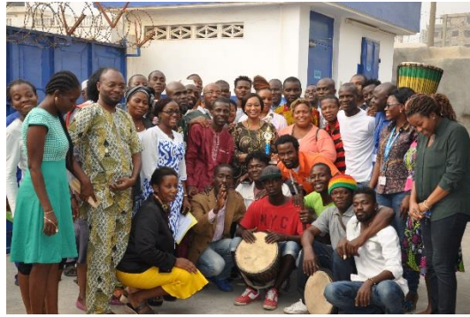
Photo de groupe lors de la cérémonie de remise des primes d'encouragement aux responsables des communautés de réfugiés

La cérémonie a été également marquée par la remise de prix à trois (03) groupes artistiques dont les membres sont tous réfugiés, notamment les groupes des chantres, des flutistes et des peintres.