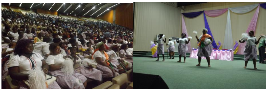
Les réfugiés au premier plan avec leur accoutrement de danse (à gauche) et la prestation du groupe folklorique des réfugiés ivoiriens, les chantres (à droite) lors de la cérémonie

Les réfugiés ont rehaussé l'éclat de la célébration par des prestations de danses folkloriques.