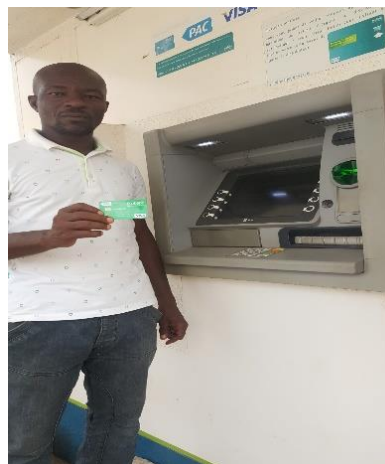
Un réfugié au guichet automatique d'ECOBANK s'appropriant à faire une opération avec sa carte CASH EXPRESS obtenu conformément à la mise en œuvre du CBI au Togo

- Management: Mbaye Diouf (depuis 27 Novembre 2017, soit plus de 2 mois)