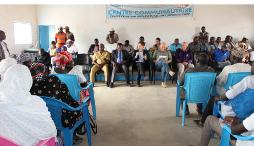
Entretien avec le Comité central des réfugiés