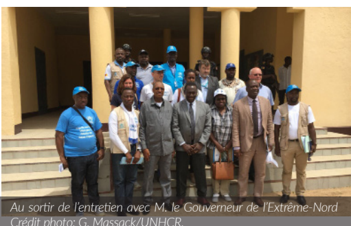
Au sortir de l'entretien avec M. le Gouverneur de l'Extrême-Nord