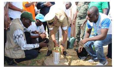
M. le Gouverneur de la Région a fait acte de reboisement Crédit photo: G. Massack/UNHCR.