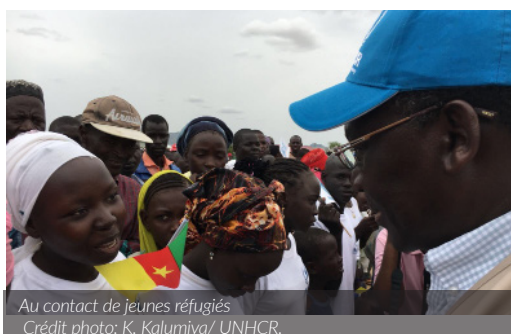
Au contact de jeunes réfugiés