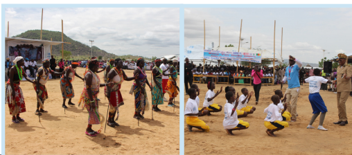
Des prestations de danses traditionnelles et modernes ont égayé l'assistance