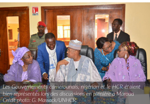
Les Gouvernements camerounais, nigérien et le HCR étaient bien représentés lors des discussions en plénière à Maroua

C'est ainsi qu'au camp des réfugiés de Minawao, les membres de la délégation ont pu s'entretenir avec les réfugiés nigériens aux travers de groupes de discussions représentatifs, au sujet de leur rapatriement librement consenti au Nigéria, dans la dignité et la sécurité. La mission de l'Extrême-Nord a également permis aux membres du Groupe Technique de Travail de revoir le plan d'action d'Abuja et d'évaluer l'état de mise en œuvre de ses dispositions. Les principales recommandations formulées par les différentes parties sont liées à la nécessité de procéder à l'enregistrement biométrique des réfugiés nigériens vivant en dehors du camp de Minawao, le renforcement de la communication au sujet de l'enregistrement des volontaires au rapatriement et les moyens de transport y relatifs.