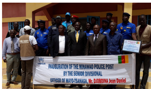
La cérémonie d'inauguration du poste de sécurité s'est déroulée en présence des autorités administratives du Mayo-Tsanaga

Le nouveau poste de sécurité du camp des réfugiés de Minawao a été inauguré le mardi, 03 juillet 2018 par Monsieur le Préfet du Département du Mayo-Tsanaga. Sur financement du HCR, 23 policiers en service au camp de Minawao seront désormais mieux accommodés.