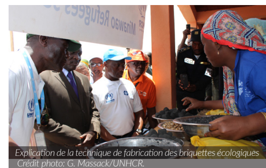
Explication de la technique de fabrication des briquettes écologiques

Autour de sketches, de poésies et autres représentations artistiques, réfugiés et humanitaires ont démontré et sensibilisé sur l'importance de la préservation de l'environnement, ainsi que les effets néfastes de la pollution plastique. Ce fut également l'occasion de décliner le chronogramme des réalisations obtenues des différentes activités qui contribuent à la restauration du couvert végétal. Dans ce sens, il importe de relever le début de la phase 2 du reboisement débutée le mardi, 08 mai 2018. Elle vise la mise en terre de plants sur 25 hectares à l'intérieur du camp de Minawao, 20 hectares de la communauté hôte de Gawar et 20 hectares de la réserve forestière de Zamaï, à travers la technologie cocoon. Elle vient renforcer la précédente de 2017 qui a vu la mise en terre de 10954 plants sur une superficie de 27,3 hectares.