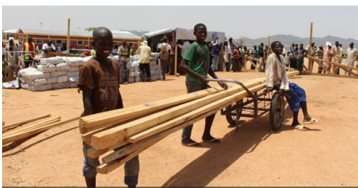
Ils aident leurs parents à transporter leurs acquisitions