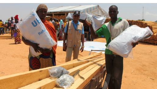
Des bénéficiaires de l'intervention Crédit photo: G. Massack/UNHCR.