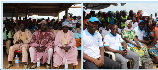
Les autorités traditionnelles locales et les humanitaires aussi