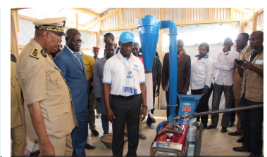
Inauguration des moulins, don du MINADER et du PAM