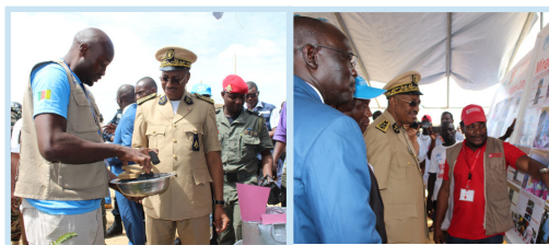
Un tour des stands d'exposition