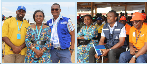
Les Agences sœurs et les partenaires étaient présents

En marge de cette cérémonie, Monsieur le Gouverneur de la Région de l'Extrême-Nord a procédé à l'inauguration et à la remise officielle à la communauté des réfugiés de 15 moulins offerts par le Ministère de l'Agriculture et du Développement Rural (05) et le PAM (10). Ils contribueront à mouler les céréales provenant des différentes récoltes et de l'approvisionnement des ménages du camp.