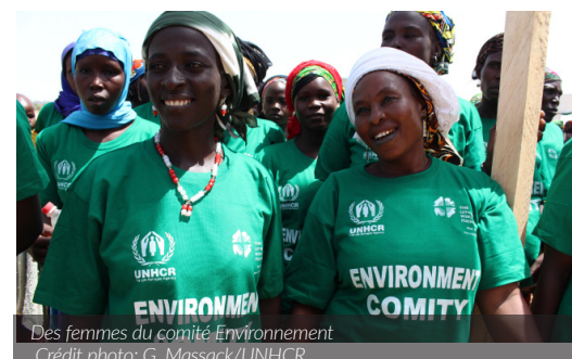
Des femmes du comité Environnement