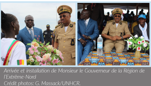
Arrivée et installation de Monsieur le Gouverneur de la Région de l'Extrême-Nord

Ce mercredi, 20 juin 2018, la communauté humanitaire de la Région de l'Extrême-Nord, les autorités administratives et traditionnelles locales, ainsi que les réfugiés du camp de Minawao, se sont joints au reste du monde pour célébrer la Journée Mondiale du réfugié. Couplée à la Journée de l'Enfant africain autour de la campagne #Aveclesréfugiés, la double commémoration a servi de forum pour réitérer le plaidoyer afin que les Gouvernements concrétisent leurs engagements internationaux et que soient garantis aux réfugiés, l'éducation, la sécurité et des moyens de subsistance.