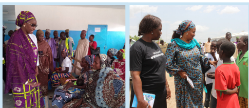
Cà et là, les préoccupations sont relevées