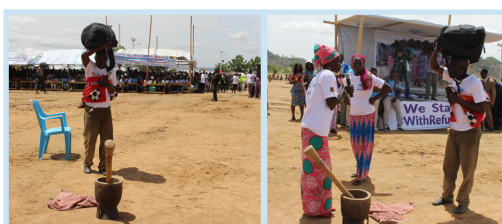
Un sketch sur les bienfaits du retour organisé a fait l'unanimité