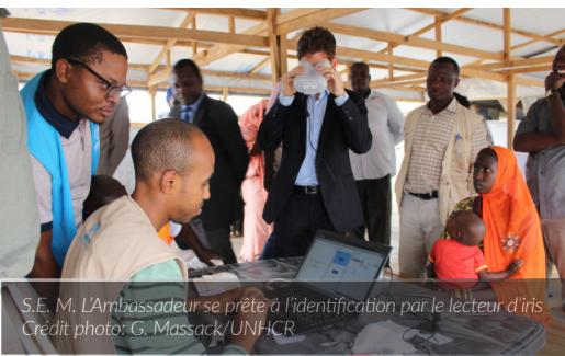
S.E. M. L'Ambassadeur se prête à l'identification par le lecteur d'iris