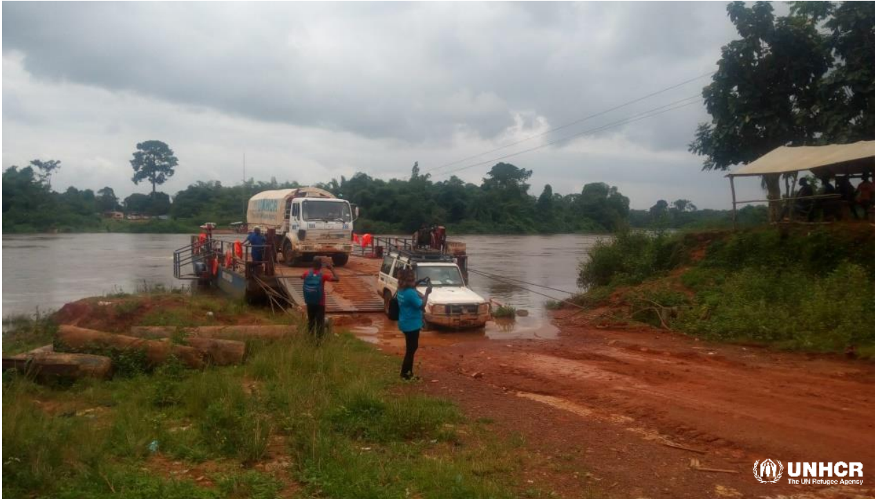
Convoi de Retour Volontaire Prolo, 16 Juillet 2018