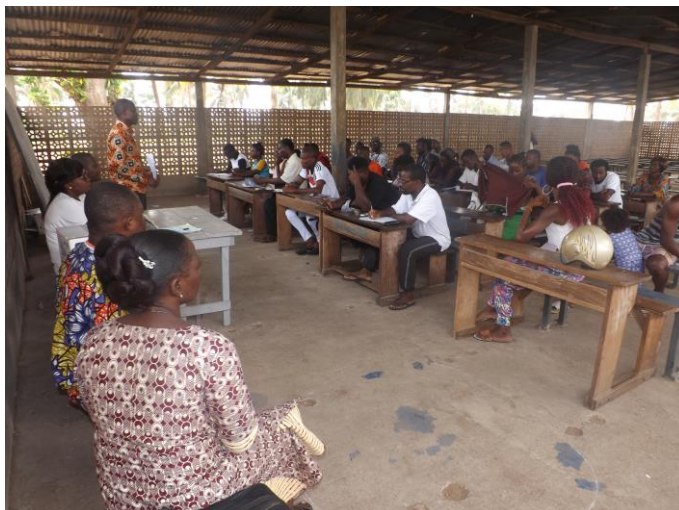
Rencontre avec les réfugiés, malades chroniques au camp d'Avepozo/ Togo