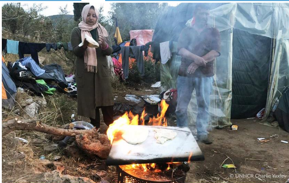
Ζευγάρι προσφύγων φτιάχνει ψωμί μπροστά από τα αυτοσχέδια καταλύματα στο κέντρο υποδοχής στο Βαθύ της Σάμου. Οι αιτούντες άσυλο πασχίζουν να αντιμετωπίσουν το σοβαρό συνωστισμό, τις αντίξοες συνθήκες διαβίωσης και την περιορισμένη πρόσβαση σε βασικές υπηρεσίες, συμπεριλαμβανομένης της υγειονομικής περίθαλψης.

1 Κεντρικό Γραφείο στην Αθήνα 10 Γραφεία σε Θεσσαλονίκη, Λέσβο, Αττική, Χίο, Σάμο, Κω, Έβρο, Ιωάννινα, Λέρο και Ρόδο