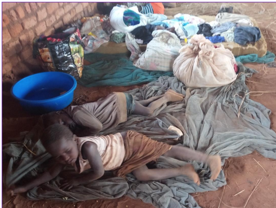
Deux enfants Sud Soudanais qui ont trouvé refuge dans une église à Karagba en RDC