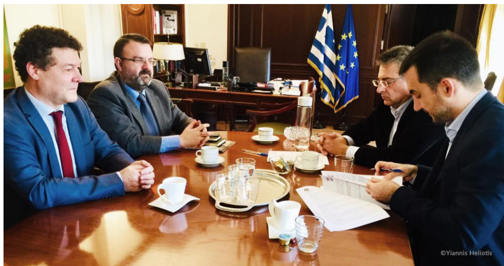
Ο Αντιπρόσωπος της Υ.Α. στην Ελλάδα Philippe Leclerc (κάτω αριστερά), ο Πέτρος Μάστακας από τον Τομέα Προστασίας της Υ.Α. (πάνω αριστερά), ο Υπουργός Εσωτερικών Αλέξης Χαρίτσης (κάτω δεξιά) και ο Ειδικός Γραμματέας Ιθαγένειας Λάμπρος Μπαλτσιώτης (πάνω δεξιά) κατά την υπογραφή του Μνημονίου Συνεργασίας.

Θεσσαλονίκη, Λέσβο, Αττική, Χίο, Σάμο, Κω, Έβρο, Ιωάννινα, Λέρο και Ρόδο